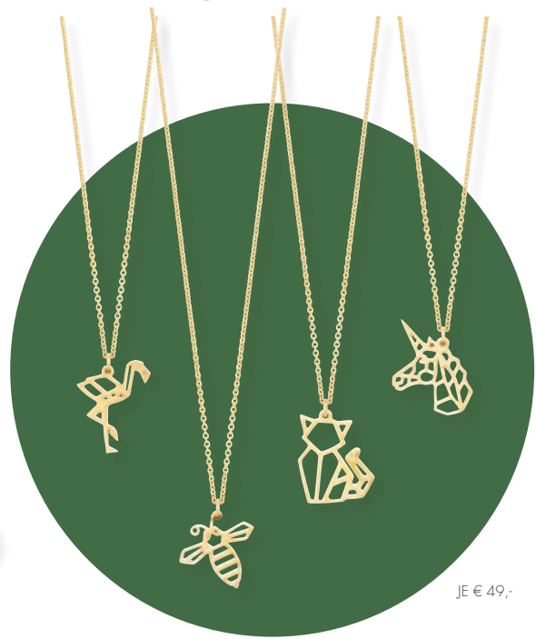
JE € 49,-